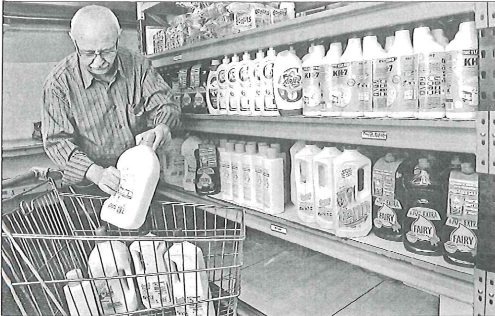
Un responsable d'El Xiprer al magatzem de l'entitat on es guarden els detergents i productes de neteja aquest dijous al matí

Els serveis socials de Mollet ja gestionen 8.000 expedients